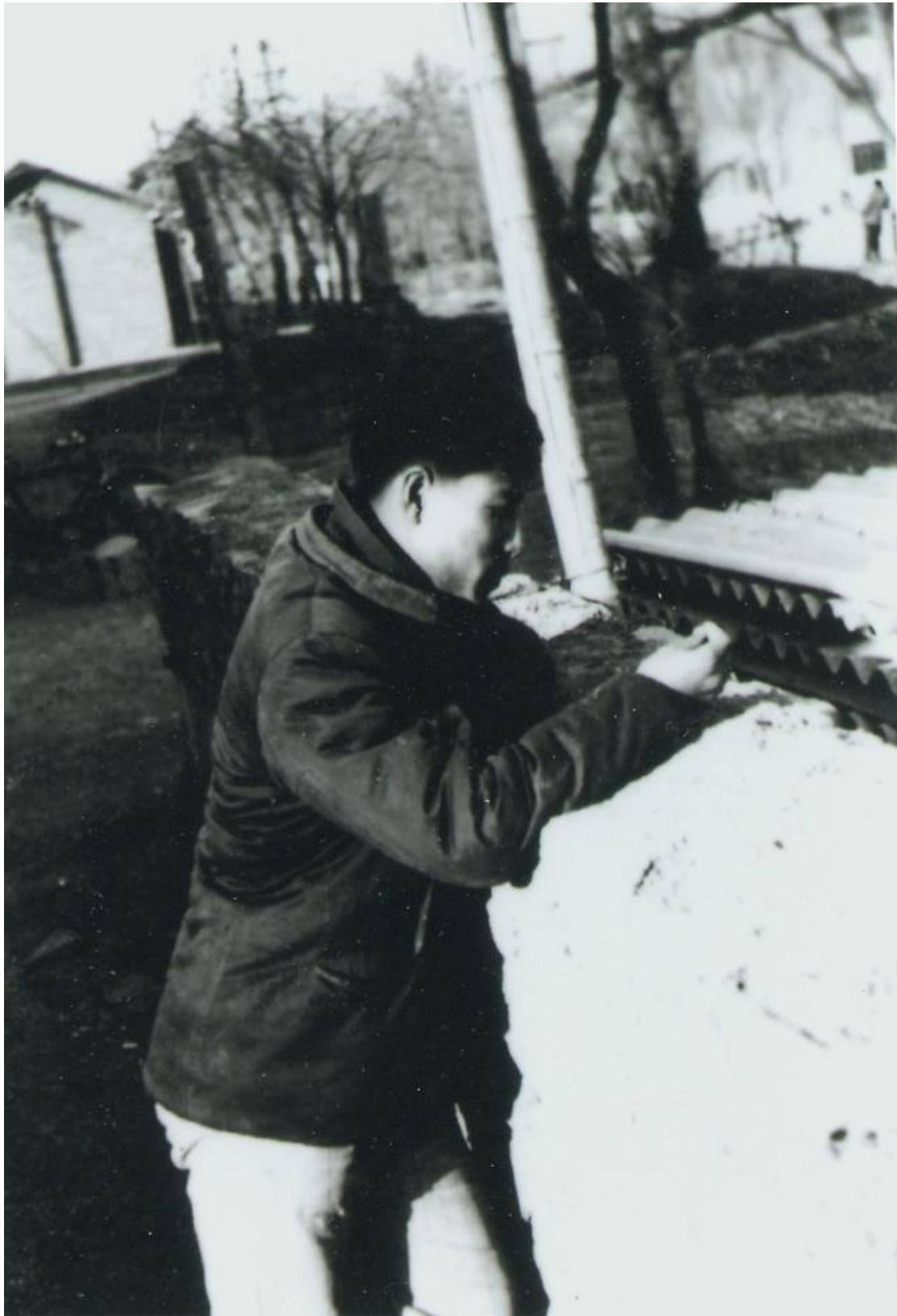
照片 3 室外留影