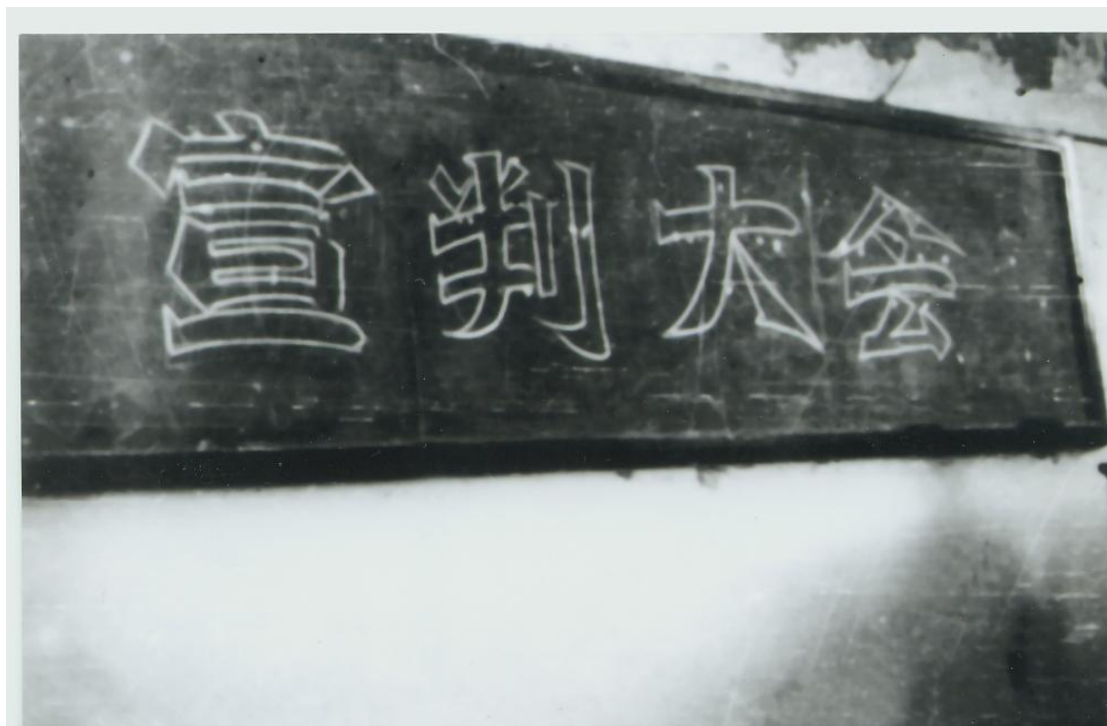
照片 1 宣判大会会场