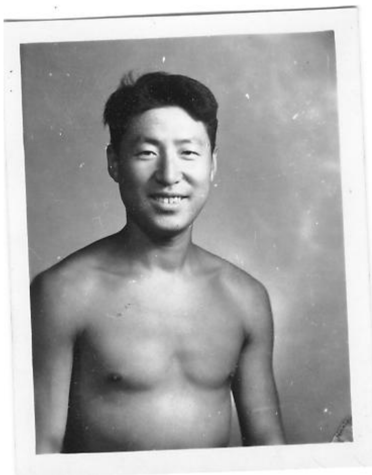
出水芙蓉：1962年解除劳教时的留影。